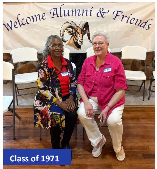
Class of 1971