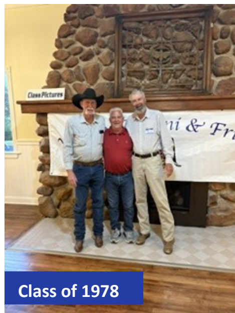
Class of 1978