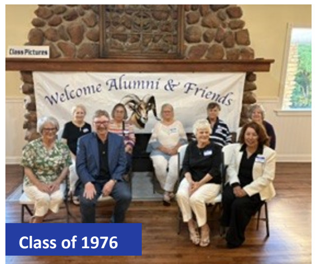
Class of 1976