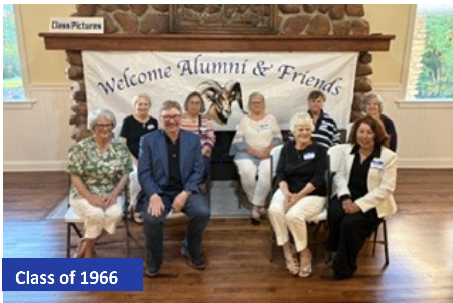
Class of 1966

We are grateful to all who attended, traveled, volunteered, and helped make the evening such a success. May God continue to bless our parish family, both near and far.