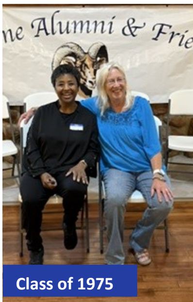
Class of 1975